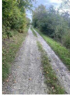
Europaradweg R1 Abschnitt Gernrode – Ballenstedt