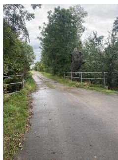
Europaradweg R1 Abschnitt Reinstedt – Friedrichsaue