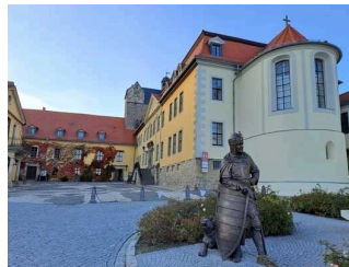
Schlosskomplex oberhalb des Schlossplatzes