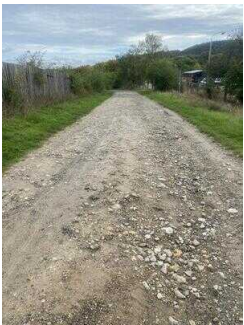
Europaradweg R1 Abschnitt Gernrode – Ballenstedt