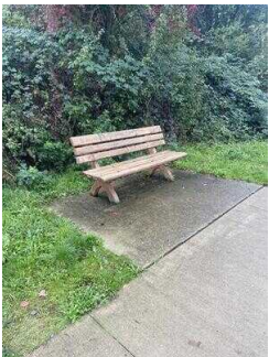
Europaradweg R1 Abschnitt Gernrode – Ballenstedt