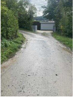
Europaradweg R1 Abschnitt Gernrode – Ballenstedt