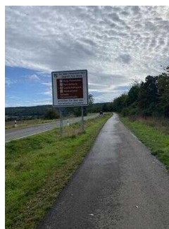
Europaradweg R1 Abschnitt Ballenstedt – Reinstedt