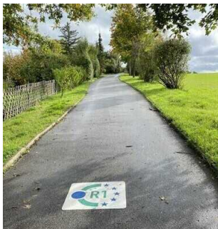
Europaradweg R1 – 48 km Teilabschnitt zwischen Thale – Friedrichsaue