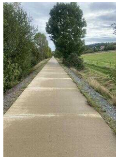
Europaradweg R1 Abschnitt Gernrode – Ballenstedt