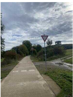
Europaradweg R1 Abschnitt Gernrode – Ballenstedt