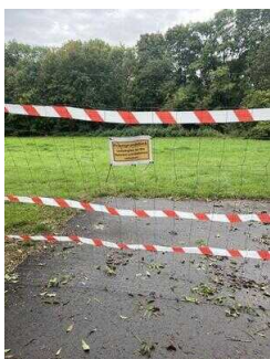
gesperrter Wegeabschnitt Privatgrundstück