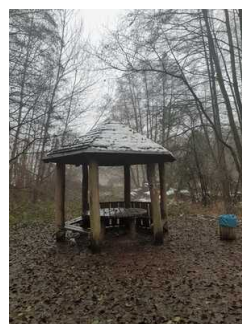
Rastplatz ca. 3 km vor Infopunkt Mosigkau