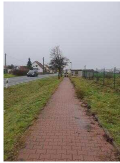
Hauptroute 33 km, 3. Abschnitt: Reppichau – Elsnigk – Osternienburg – Köthen (Anhalt)