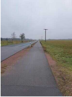
Hauptroute 33 km, 2. Abschnitt: Mosigkau – Chörau – Reppichau