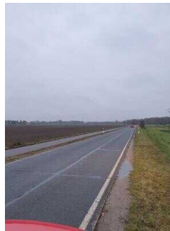
Hauptroute 33 km, 2. Abschnitt: Mosigkau – Chörau – Reppichau