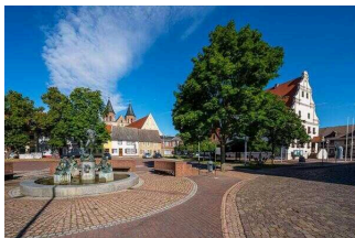
Aken, Markt mit Brunnen, 2020