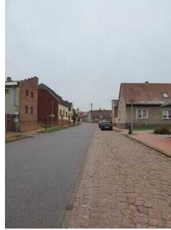
Hauptroute 33 km, 2. Abschnitt: Mosigkau – Chörau – Reppichau