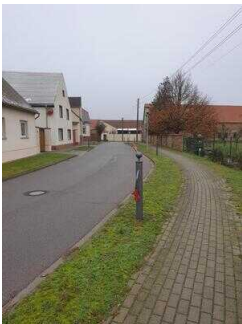
Hauptroute 33 km, 2. Abschnitt: Mosigkau – Chörau – Reppichau