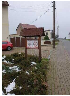
Hauptroute 33 km, 3. Abschnitt: Reppichau – Elsnigk – Osternienburg – Köthen (Anhalt)