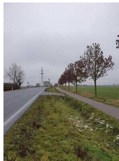
Hauptroute 33 km, 3. Abschnitt: Reppichau – Elsnigk – Osternienburg – Köthen (Anhalt)