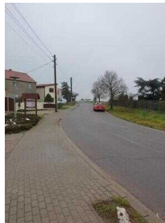
Hauptroute 33 km, 2. Abschnitt: Mosigkau – Chörau – Reppichau