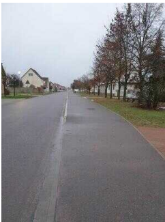
Hauptroute 33 km, 2. Abschnitt: Mosigkau – Chörau – Reppichau