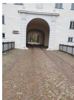
Hauptroute 33 km, 3. Abschnitt: Reppichau – Elsnigk – Osternienburg – Köthen (Anhalt)