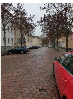
Hauptroute 33 km, 3. Abschnitt: Reppichau – Elsnigk – Osternienburg – Köthen (Anhalt)