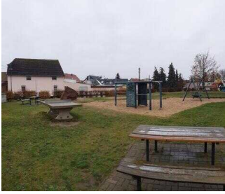
Rastplatz in Osternienburg