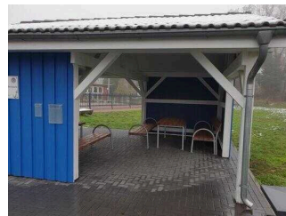
Wasser- und Gesundheitspark Aken