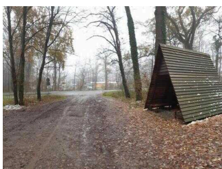
Schutzhütte am Ortseingang Aken