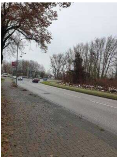
Hauptroute 33 km, 3. Abschnitt: Reppichau – Elsnigk – Osternienburg – Köthen (Anhalt)