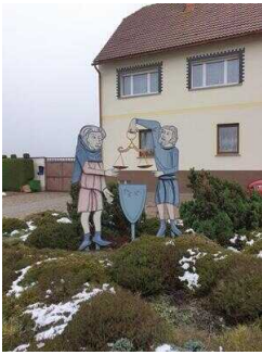
Hauptroute 33 km, 3. Abschnitt: Reppichau – Elsnigk – Osternienburg – Köthen (Anhalt)