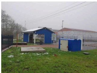
Wasser- und Gesundheitspark Aken