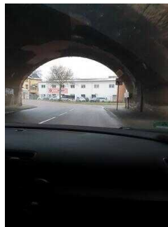
Hauptroute 33 km, 3. Abschnitt: Reppichau – Elsnigk – Osternienburg – Köthen (Anhalt)