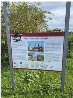
Europaradweg R1 Abschnitt Thale – Gernrode