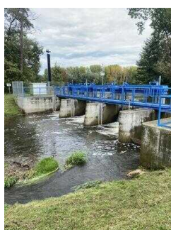
Europaradweg R1 Abschnitt Reinstedt – Friedrichsaue