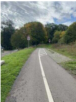
Europaradweg R1 Abschnitt Ballenstedt – Reinstedt