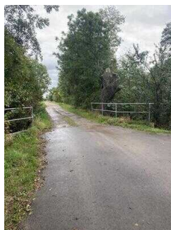
Europaradweg R1 Abschnitt Reinstedt – Friedrichsaue