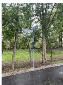
Europaradweg R1 Abschnitt Reinstedt – Friedrichsaue