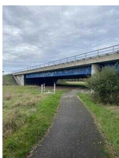
Europaradweg R1 Abschnitt Reinstedt – Friedrichsaue