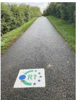
Europaradweg R1 Abschnitt Thale – Gernrode