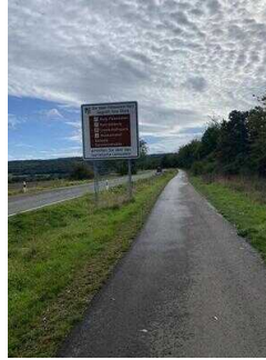
Europaradweg R1 Abschnitt Ballenstedt – Reinstedt