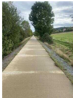
Europaradweg R1 Abschnitt Gernrode – Ballenstedt