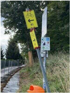
Europaradweg R1 Abschnitt Thale – Gernrode