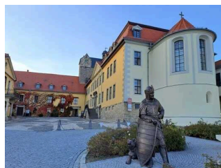
Schlosskomplex oberhalb des Schlossplatzes