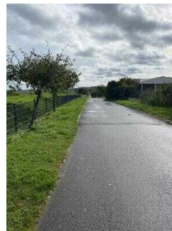
Europaradweg R1 Abschnitt Thale – Gernrode