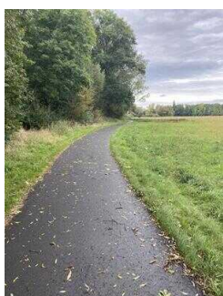
Europaradweg R1 Abschnitt Reinstedt – Friedrichsaue