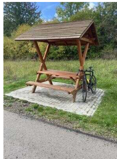
Europaradweg R1 Abschnitt Ballenstedt – Reinstedt