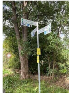
Europaradweg R1 Abschnitt Thale – Gernrode