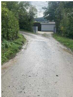
Europaradweg R1 Abschnitt Gernrode – Ballenstedt