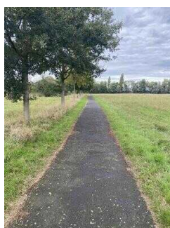
Europaradweg R1 Abschnitt Reinstedt – Friedrichsaue