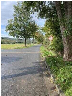
Europaradweg R1 Abschnitt Thale – Gernrode