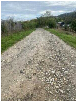
Europaradweg R1 Abschnitt Gernrode – Ballenstedt