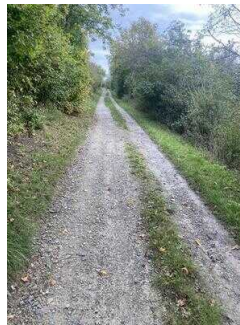
Europaradweg R1 Abschnitt Gernrode – Ballenstedt