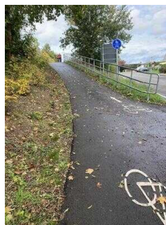
Europaradweg R1 Abschnitt Ballenstedt – Reinstedt