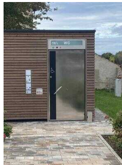
Europaradweg R1 Abschnitt Ballenstedt – Reinstedt