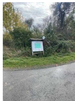
Europaradweg R1 Abschnitt Thale – Gernrode