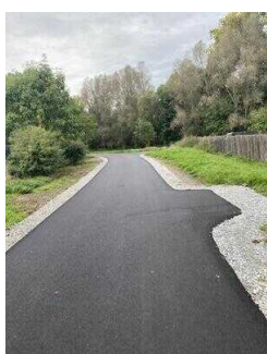
Europaradweg R1 Abschnitt Reinstedt – Friedrichsaue