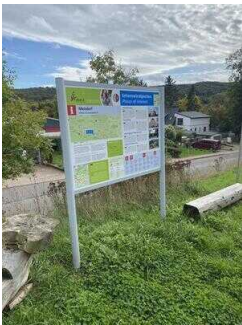
Europaradweg R1 Abschnitt Ballenstedt – Reinstedt