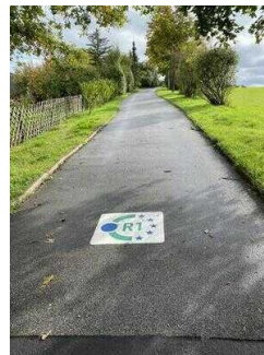
Europaradweg R1 Abschnitt Thale – Gernrode