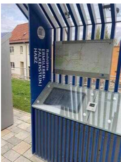
Radstätte Ermsleben– Falkenstein